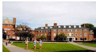
學校、宿舍& 測溫門禁管理