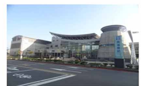
公共車站 閘門溫度偵測