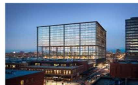
企業辦公室 門禁考勤