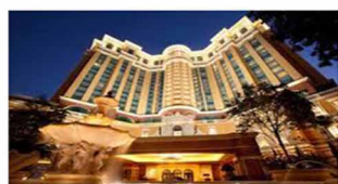
飯店客房 門禁管理