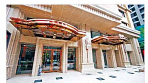
社區大樓 門禁管理