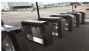
科技工廠測溫 門禁考勤管理