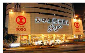
百貨餐廳測溫 門禁考勤管理